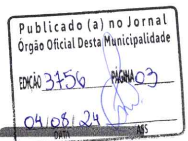
WALDEMAR NAVES COCCO JUNIOR Prefeito Municipal

EDIFÍCIO DA PREFEITURA MUNICIPAL DE PARANACITY, PR, 31 DE JULHO DE 2024.